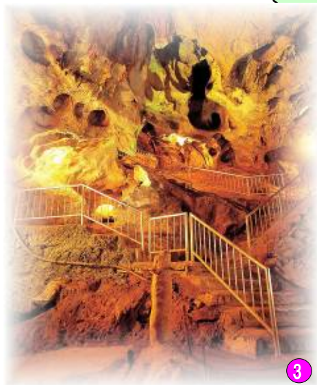
③ 関東一の規模を誇る鍾乳洞 「不二洞」 上野村