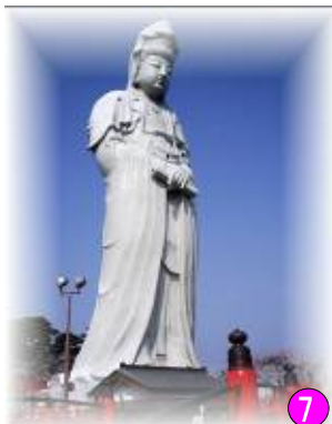
⑦ 高さ41.8mのスケール 「白衣大観音」 高崎市