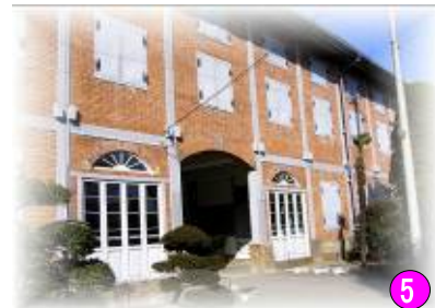
⑤ 世界遺産暫定リストに登載された 「富岡製糸場」 富岡市