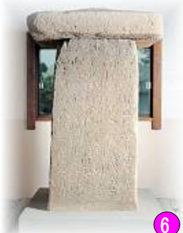
⑥ 日本三古碑のひとつ 「多胡碑」 吉井町