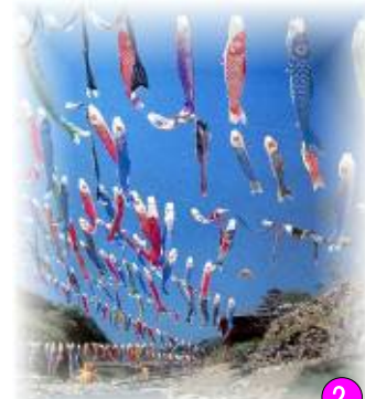
② 関東一の清流神流川の上空を 800匹の鯉のぼりが泳ぐ(5月) 「鯉のぼり祭り」 神流町