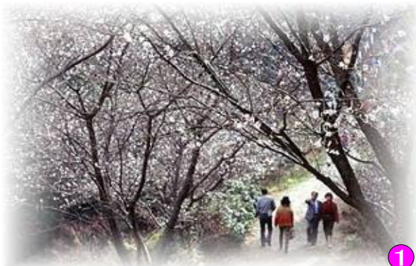
① 日本一を誇る約7,000本の冬桜と春はソメイ吉野 「桜山公園」 藤岡市