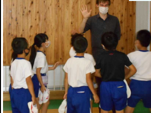
体育館出口でサンキュー