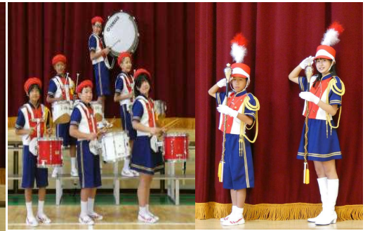
【↑打楽器】 【↑メジャー】 【←集合写真】 【↓トランペット(左)・トロンボーン(右)】