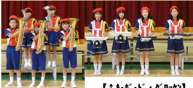
【↑キーボード・ギター】